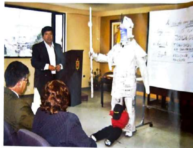
Talleres de socialización del Código de Ética en las dependencias del Municipio Metropolitano de Quito.

La obra de teatro "Farra Bestial" sobre valores, compuesta y actuada por estudiantes de la Unidad Educativa Municipal Sucre fue vista y discutida por 2 000 estudiantes de 12 instituciones educativas de Quito.