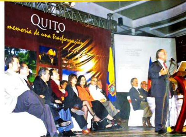
Información pública El ex Alcalde Paco Moncayo rindió cuentas de su gestión, de las obras cumplidas y las pendientes.

Quito Honesto monitorea el cumplimiento de la "Rendición de Cuentas" a fin de mejorar e incorporar nuevos mecanismos para que la gestión municipal sea transparente.