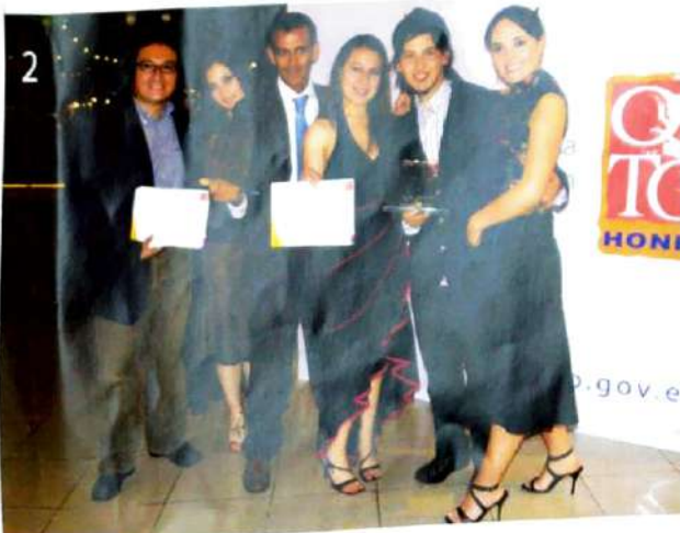
Ganadores del concurso interuniversitario "Juntos por un Quito Honesto", que se realizó en mayo de 2007, con gran aceptación.