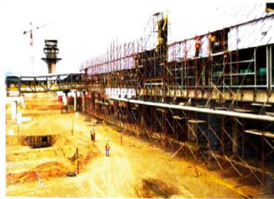
1 200 personas trabajan en las diferentes áreas de construcción ( terminal de pasajeros, parqueadero para los aviones, estacionamiento de vehículos, torre de control, vías y pista). El financiamiento proviene de organismos y entidades de crédito internacionales.

La Veeduría del Nuevo Aeropuerto del Distrito Metropolitano de Quito se constituyó como un sistema de gestión participativa, con el propósito de transparentar el procedimiento precontractual del proyecto y aclarar las principales dudas de la ciudadanía. Es una instancia ciudadana, apolítica e