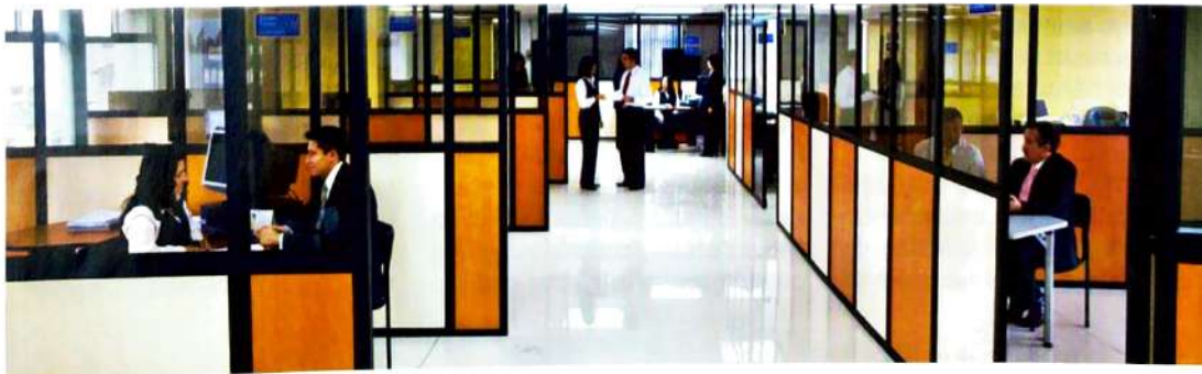
Quito Honesto cuenta con oficinas amplias y transparentes.

*Los presupuestos 2002, 2003 y 2004 fueron ejecutados directamente por la Dirección Administrativa de la Municipalidad.