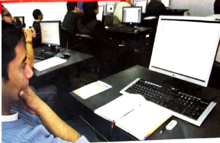
La población en general puede acceder a la información del Municipio por diferentes vías, por ejemplo, Internet, conferencias, etc. Quito Honesto facilitó estos procesos para que los datos no resulten técnicos, sino de fácil entendimiento.