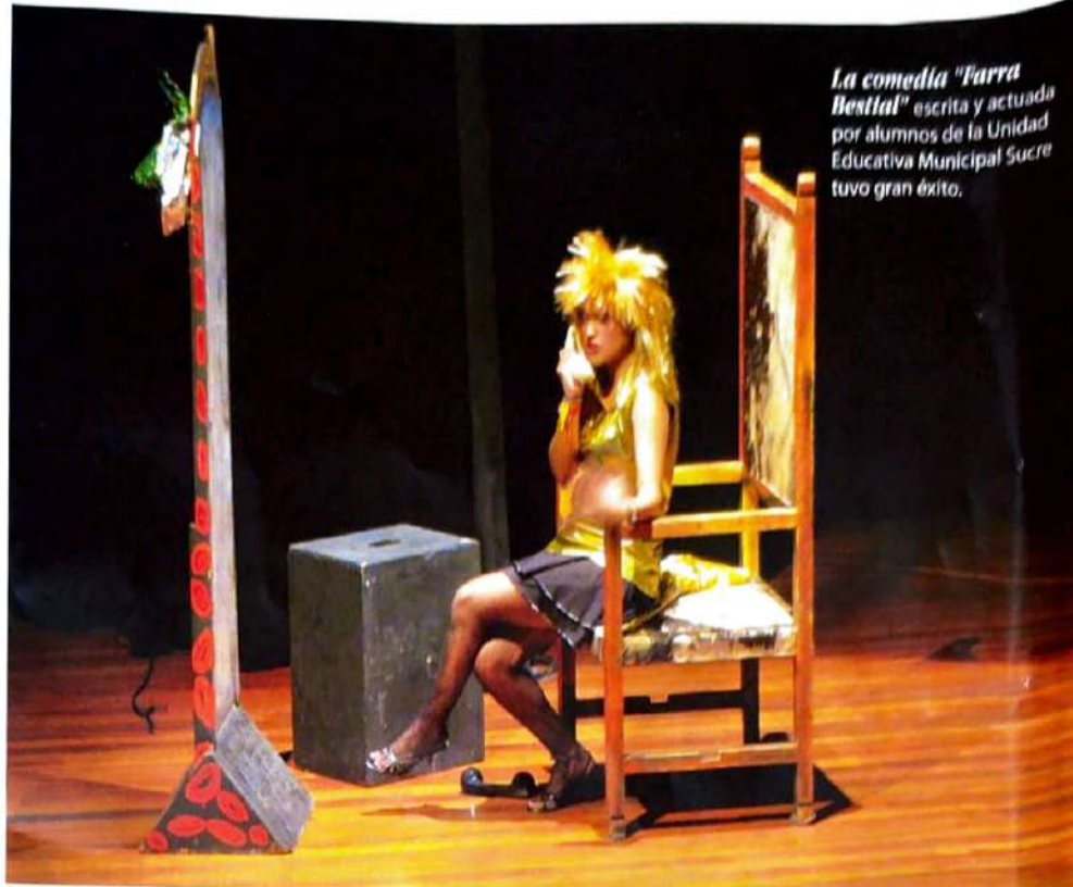
La comedia "Farra Bestial" escrita y actuada por alumnos de la Unidad Educativa Municipal Sucre tuvo gran éxito.

En Comunicación se destaca un concurso interuniversitario con la participación de jóvenes de varios centros de educación su-